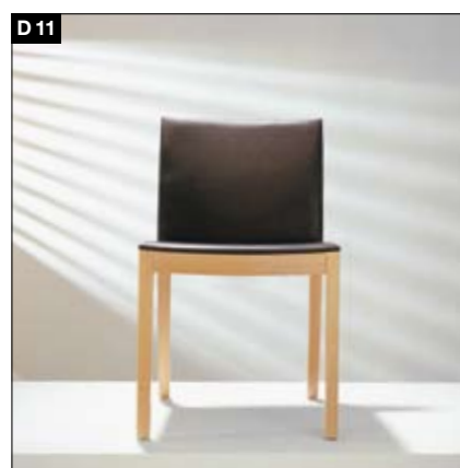
D11 Massivholzgestell 2 Rückenhöhen, wahlweise mit oder ohne Armlehne. Ergonomische Ausformung von Sitzfläche und Rücken