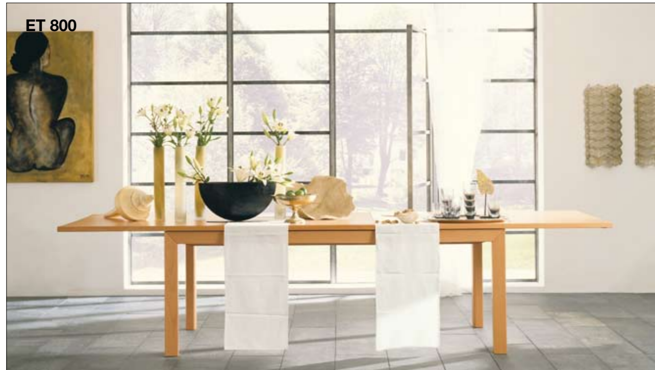
ET 800 Tischplatte: Massivholz (bei Erle-massiv), 5-Lagen-Vollholzplatte (bei den anderen Ausführungen) Füße: Massivholz Ausführungen: Massivholz: Erle-massiv, 5-Lagen-Vollholzplatte: Buche massiv, Natureiche-massiv Tischlängen: 160, 180, 200 cm Verlängerbar von: 160-220/280 cm, 180-240/300 cm, 200-260/320 cm