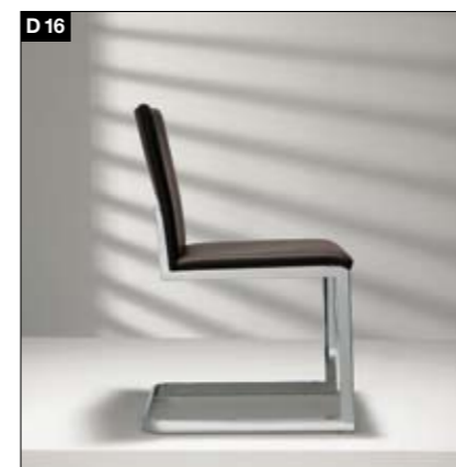
D16 Stuhlmodell mit und ohne Armlehne/Barhocker Fußgestell: Sitzschale aus Formholz oder mit Polsterschalen auf Metallgestell. Gestelle aus Rechteck-Stahlrohr (Chrom-hochglänzend/Chrom-matt). Barhocker wahlweise mit Rückenbügel oder Rückenlehne.