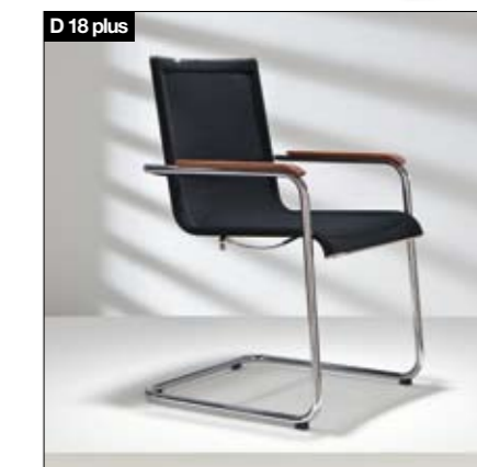
D18 plus Freischwinger Fußgestell: Chrom-hochglänzend/Chrom matt, mit und ohne Armlehnen, Sitz- und Rückenlehne mit Formstrick bezogen (transparent/Sitzfläche blickdicht).