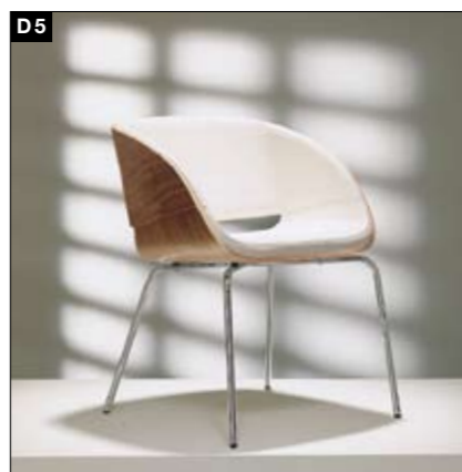
D5 Formholz-Schalenstuhl Fußgestell: aluminiumfarbig-pulverbeschichtet/ Chrom-hochglänzend/Chrom-matt/Chrom-schwarz Sorgfältig verarbeitete und gepolsterte Innenschale