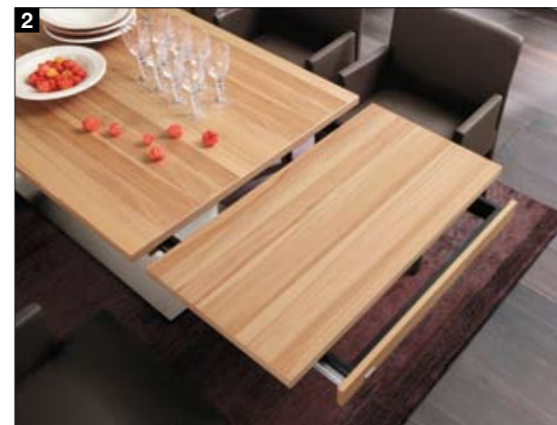
2 Soll der Tisch verlängert werden, zieht man eine seitliche Lade heraus und legt eine Verlängerungsplatte darauf. Leicht Heranschieben und die Verlängerung ist arretiert.