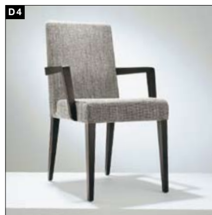
D4 Fußgestell: Massivholz 2 Rückenhöhen, 2 Armlehnenvarianten. Dauerelastische, geflochtene Gurtunterfederung

Sitzen Sie gerade bequem? Dann können Sie sich ja ganz in Ruhe unsere große Auswahl unterschiedlicher Stühle anschauen. Von bodenständig bis filigran, von klassisch bis modern, vom Einziter bis zum Mehrsitzer. Und wenn Sie anfangen, etwas unruhig hin- und herzurutschen können Sie sicher sein, Ihr Traumobjekt entdeckt zu haben.