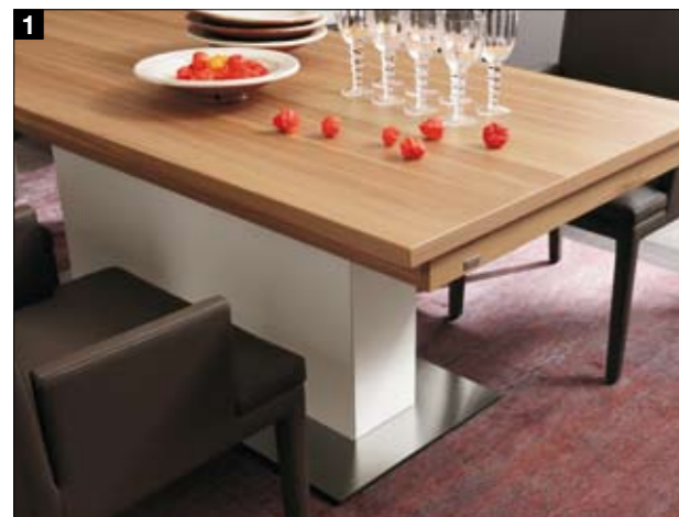
1 Diese Tischsäule hat es in sich: Sie verbirgt die Verlängerungsplatten hinter einer kleinen seitlichen Tür, wenn sie einmal nicht benötigt werden.