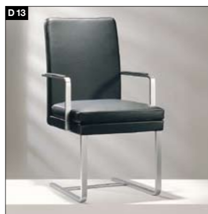
D13 Polsterstuhl Fußgestell: Chrom-hochglänzend/Chrom-matt/Chrom-schwarz 3 Gestellvarianten: Flachstahlrohr-Freischwinger, Quadratrohrgestell, Tellerfuß, 2 Rückenhöhen, 2 Sitzbreiten, 3 Sitzkomforts: lose Sitzkissen in fest-mittel-weich