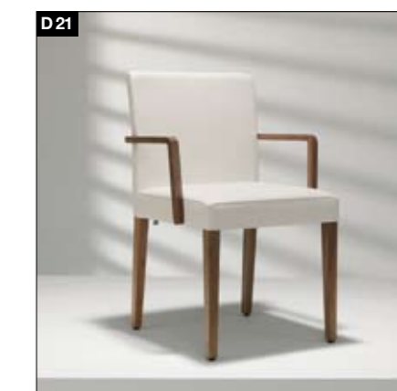
D21 Massivholzgestell 2 Rückenhöhen (85,5 cm und 94,5 cm), mit oder ohne Holzarmlehnen, Gummigurtunterfederung als Grundlage des Polsteraufbaus, Rückenlehne mit eingebautem Federstahl - gibt bei Druck nach und passt sich dem Körper an. Die Sitzpolsterung garantiert bequemes Sitzen.