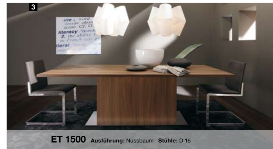
Die Tischplatte gibt es in 2 Tiefen und 4 festen Längen. Verlängerbar stehen 3 Längen zur Wahl. Maximale Länge ausgezogen 350 cm.