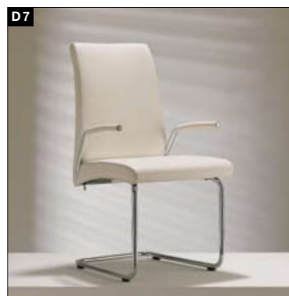
D7 Freischwinger Fußgestell: aluminiumfarbig-pulverbeschichtet/ Chrom-hochglänzend/Chrom-matt/Chrom-schwarz 2 Rückenhöhen, 2 Armlehnenvarianten Rückenlehne mit leichter Kippfunktion