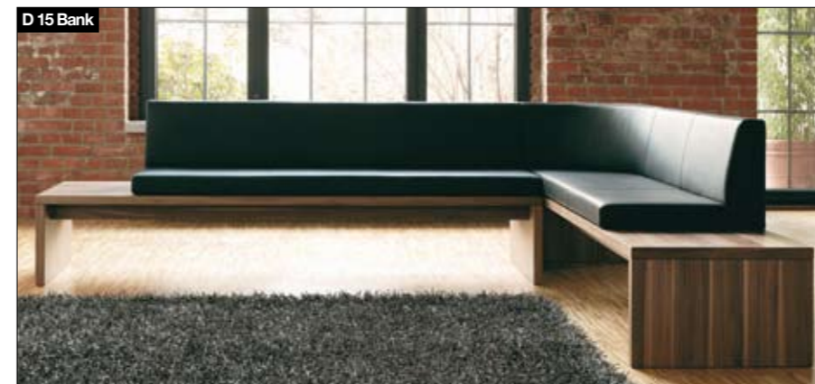
D15 Bank Banksystem Solitärbanke mit/ohne Rückenlehne, Solitärbanke mit seitlicher Ablage, Bank mit integrierter Ecke, Eckbank. Schlichte, geradlinige Formensprache, elegante Ausstrahlung. Große Bequemlichkeit und Möglichkeit der Positionierung frei im Raum.