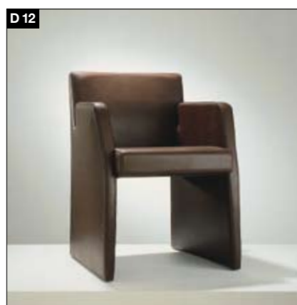
D12 Polsterstuhlsessel Durchgehende Armlehne Exakte, hochwertig verarbeitete Nahtführung