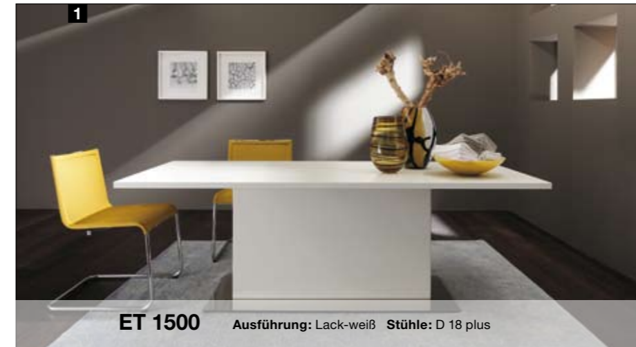
Ganz in Lack-weiß gibt der ET 1500 den idealen Partner für Begleiter wie den Stuhl D 18 plus ab, der in vielen attraktiven Farbtönen zu haben ist.