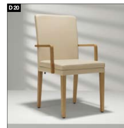
D20 Phänomenal individuell. Unglaublich bequem. 2 verschiedene Stuhlmodelle: D 20 mit Massivholzgestell oder mit komplettem Lederbezug. 2 verschiedene Rückenhöhen, 2 Sitzbreiten (Standard: 44/46 cm / Komfort: 48/50 cm), 3 Sitzhärten (fest - mittel - weich), 2 Armlehnenvarianten (ohne Armlehnen, mit geschlossener Polsterarmlehne oder mit offener Holzarmlehne).