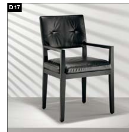
D17 Massivholzgestell Legere, komfortable Sitz-/Rückenpolsterung. Optional mit Armlehnen. Hochwertige Bezugsmaterialien werden individuellen Ansprüchen gerecht.