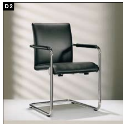
D2 Freischwinger Fußgestell: aluminiumfarbig-pulverbeschichtet/ Chrom-hochglänzend/Chrom-matt/Chrom-schwarz 2 Rückenhöhen, 2 Armlehnenvarianten Optional: EASY-GLIDER-Funktion (Rückenlehnen- neigung durch Gewichtsverlagerung variabel)