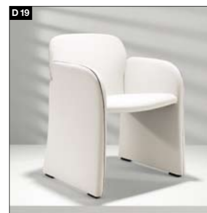
D19 Polstersessel Sitzrahmen mit geflochtener Gurtunterfederung, Polsterung aus hochwertigem PU-Kaltschaum, federnde Rückenlehne, Keder aus Baumwoll-Ripsband.