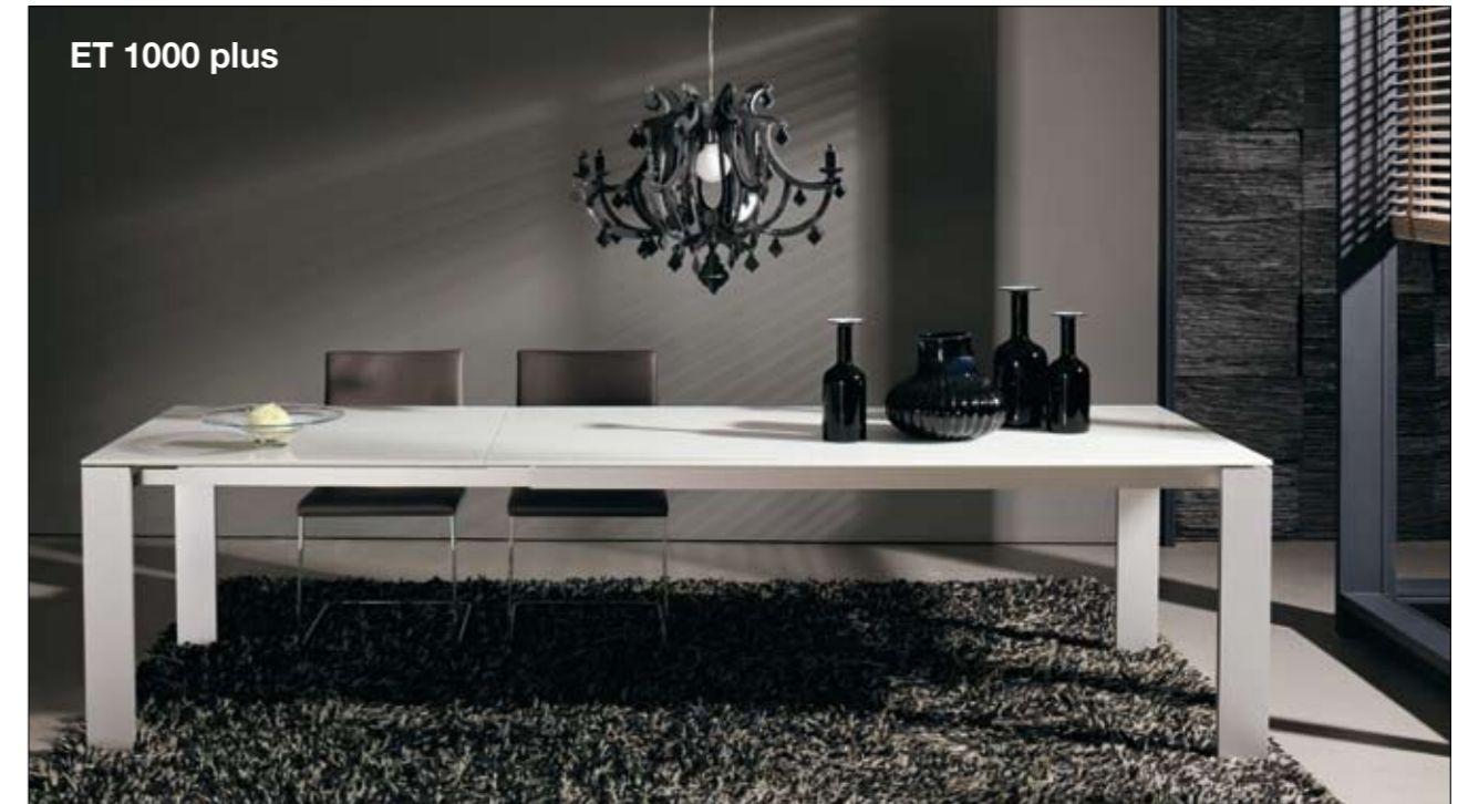
ET 1000 plus Tischplatte: Holz bzw. Glas weiß bzw. sand hinterlackiert, weiß hinterlackiert/satiniert Fußgestell: Aluminium Ausführungen: Braunkernesche, Kernussbaum Tischlängen: 160, 190, 220 cm Verlängerbar: 160-220 cm, 190-290 cm, 220-320 cm