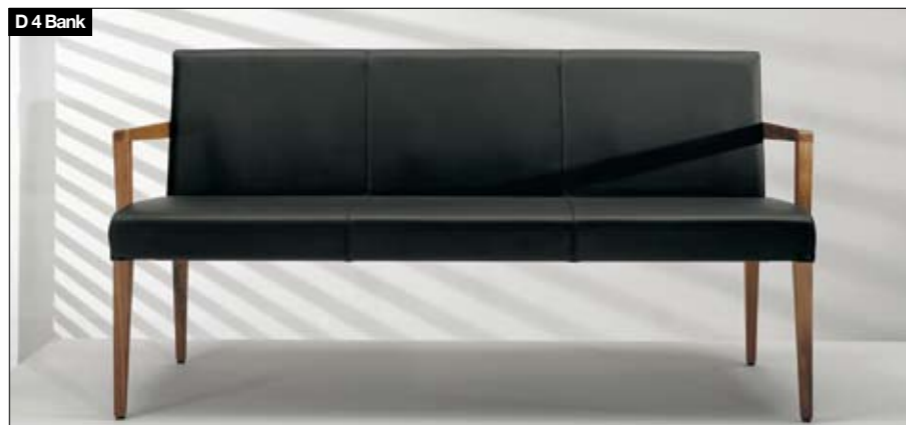
D4 Bank Fußgestell: Massivholz, 4 Breiten, 2 Rückenhöhen, 1 Armlehnenversion in der jeweiligen Holz Ausführung. Dauerelastische, geflochtene Gummigurtunterfederung