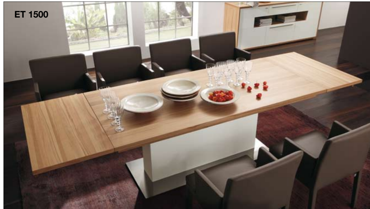
Fußsäule/Tischplatte: Lack-weiß, Strukturbuche, Nussbaum, Braunkernesche, Kernnussbaum Tischlängen: 180, 200, 220, 240 cm Verlängerbar bei Breite 95 cm: 200-310 cm, 220-330 cm, 240-350 cm Verlängerbar bei Breite 110 cm: 220-330 cm, 240-350 cm