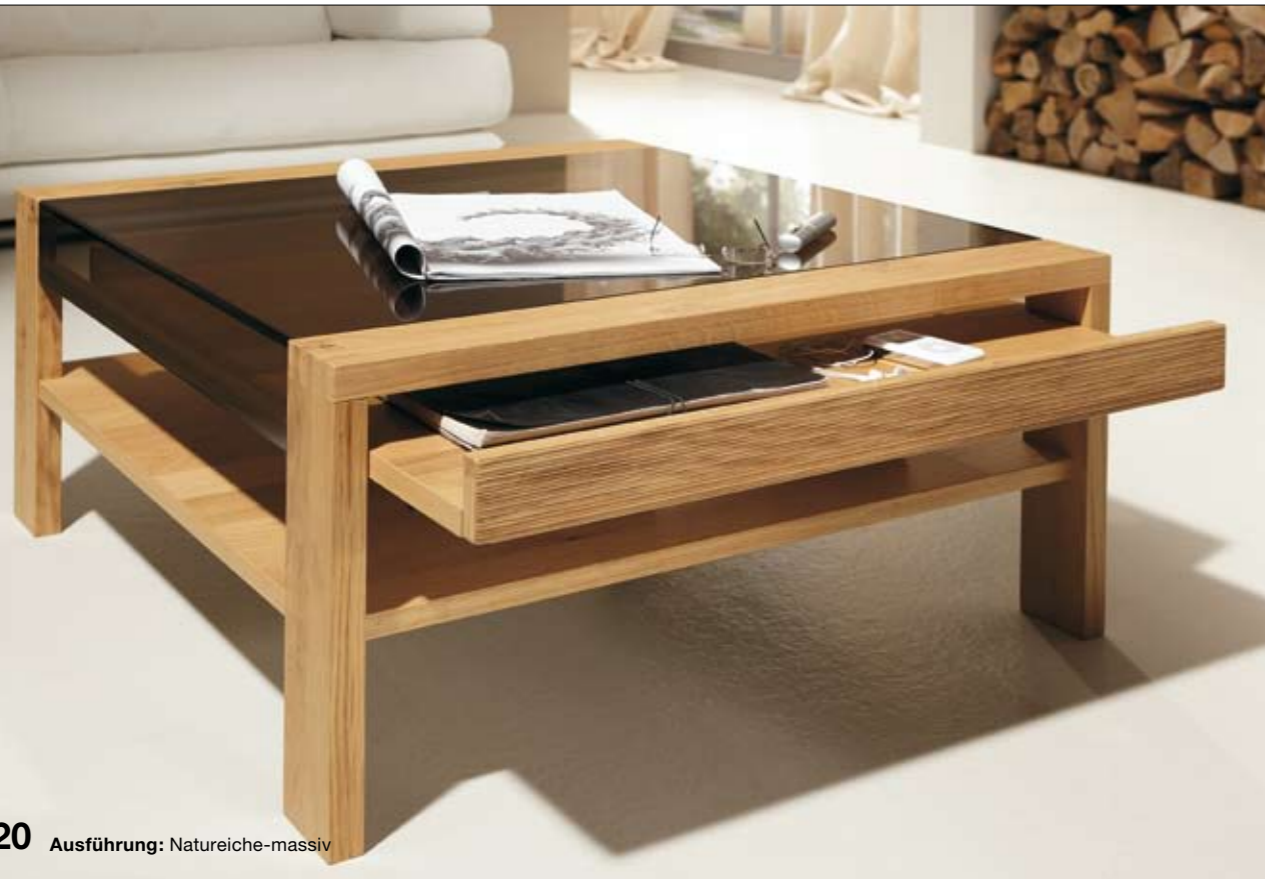
CT 120 Ausführung: Natureiche-massiv

1 Eine interessante Variante! Den CT 120 können Sie auf Wunsch mit einer Schublade in der vollen Größe der Tischplatte erhalten. Durch das bronzierte Glas sind hübsche Dinge gut sichtbar, die auf dem furnierten Boden der Schublade abgelegt wurden.