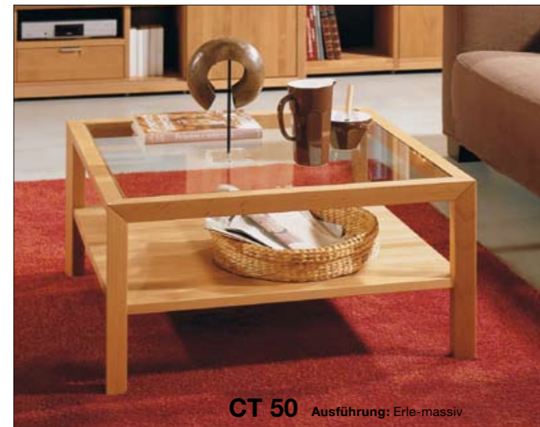
CT 50 Ausführung: Erle-massiv

Ob quadratisch oder länger als breit: Den 45,0 cm hohen CT 10 gibt es in den Abmessungen 70 x 70, 90 x 90 und 120 x 70 cm. Die obere Tischplatte kann – ganz nach Ihren Wünschen – aus Holz, aus hinterlackiertem Glas weiß oder sand, aus Klar- glas, satiniertem Glas oder getö- tem Glas sein. Die untere Platte ist immer aus Holz.