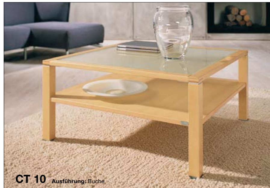
CT 10 Ausführung: Buche

Ob quadratisch oder länger als breit: Den 45,0 cm hohen CT 10 gibt es in den Abmessungen 70 x 70, 90 x 90 und 120 x 70 cm. Die obere Tischplatte kann – ganz nach Ihren Wünschen – aus Holz, aus hinterlackiertem Glas weiß oder sand, aus Klar- glas, satiniertem Glas oder getö- tem Glas sein. Die untere Platte ist immer aus Holz.