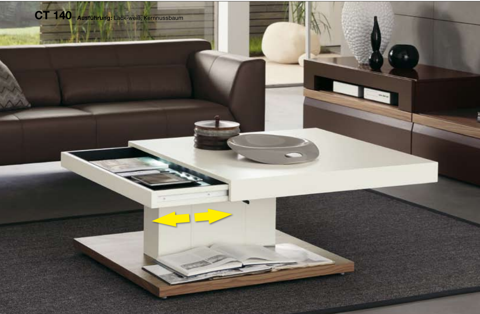
CT 140 Ausführung: Lack-weiß, Kernussbaum

obere in Lack-weiß oder Lack-braunschwarz. Die Tischplatte ist stufenlos höhenverstellbar und kann seitlich verschoben werden. Darunter verbirgt sich ein praktisches Fach, das auf Wunsch mit Innenbeleuchtung ausgestattet ist.