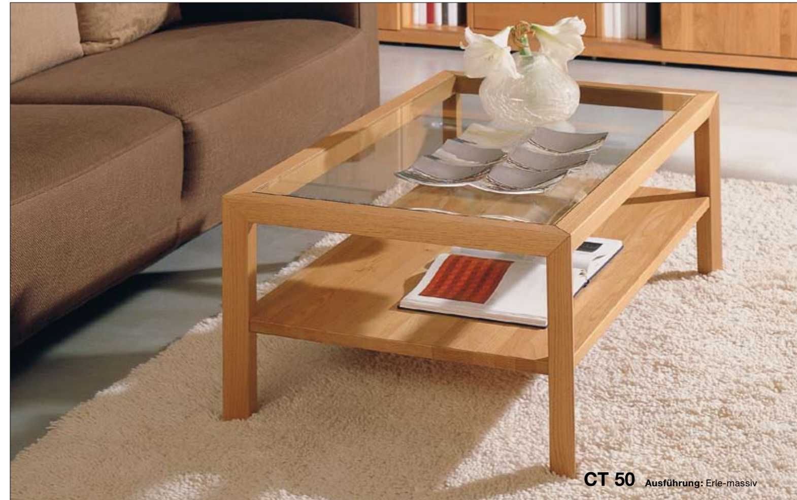
CT 50 Ausführung: Erle-massiv