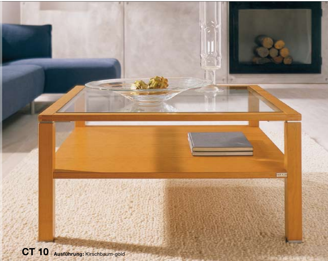
CT 10 Ausführung: Kirschbaum-gold