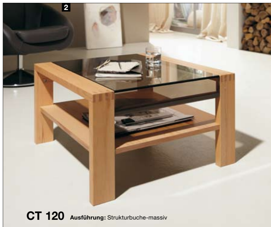
CT 120 Ausführung: Strukturbuche-massiv

2 Weniger ist mehr! Der CT 120 ist durch seine klares Design und das edle massive Holzgestell auch ohne die Schublade eine ansehnliche Schönheit. Ob als kleineres Quadrat mit den Maßen 70 x 70 cm oder etwas größer in 90 x 90 cm.